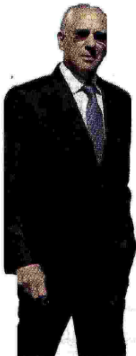
Qui a lato, il presidente dell'Anas Pietro Ciucci