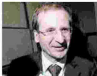
Zanardi (Upb) L'economista denuncia: così si cristallizzano le differenze

Tale regola, va ricordato, è talmente contraria al buon senso e agli obiettivi del federalismo che la Commissione bicamerale per il federalismo fiscale ha chiesto al governo di togliere per il 2017 quegli zeri sul trasporto pubblico locale e sugli asili nido. Il governo Renzi non ha avuto il tempo di dare una risposta. Ecco perché l'esecutivo Gentiloni, che ha fatto dell'attenzione al Sud un proprio marchio di fabbrica, ha l'occa-