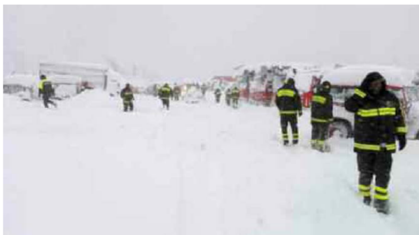
Vigili del fuoco in azione sotto la neve nell'entroterra abruzzese

L'AQUILA - Calamità naturali in serie sull'Abruzzo, devastato e terrorizzato da nevicate, allagamenti, esondazioni di fiumi e, in ultimo, quattro scosse di terremoto di magnitudo superiore a 5 con epicentro nell'area di Monteleone, dove le persone sono bloccate in casa da un metro e mezzo di neve. Una vittima e un disperso finora, rispettivamente un uomo di 83 anni rimasto sepolto nel crollo della sua stalla in una frazione di Castel Castagna a Teramo e un uomo di 60 anni finito sotto a una slavina a Campotosto. Nel Teramo un ragazzino ed una giovane donna sono stati estratti vivi dalle macerie della loro abitazione a Castiglione Messer Raimondo; nel Pescara il dipendente di un supermercato è stato tratto in salvo dopo il crollo del tetto. Una valanga avrebbe investito l'hotel Rigo-piano di Farindola, alle falde del Gran Sasso pescarese, dove sono ospitati due ragazzi di Giulianova: l'allarme è stato dato da due clienti. Una situazione d'emergenza da oltre 72 ore, cominciata con una intensa nevicata pesante che ha messo in ginocchio la regione, con migliaia di persone senza corrente elettrica - un servizio che oscilla tra le 87 mila e le 120 mila utenze disalimentate - e senza acqua in molti Comuni delle tre province della costa adriatica; ad aggravare il tutto, nelle ultime ore, prima l'esonda-