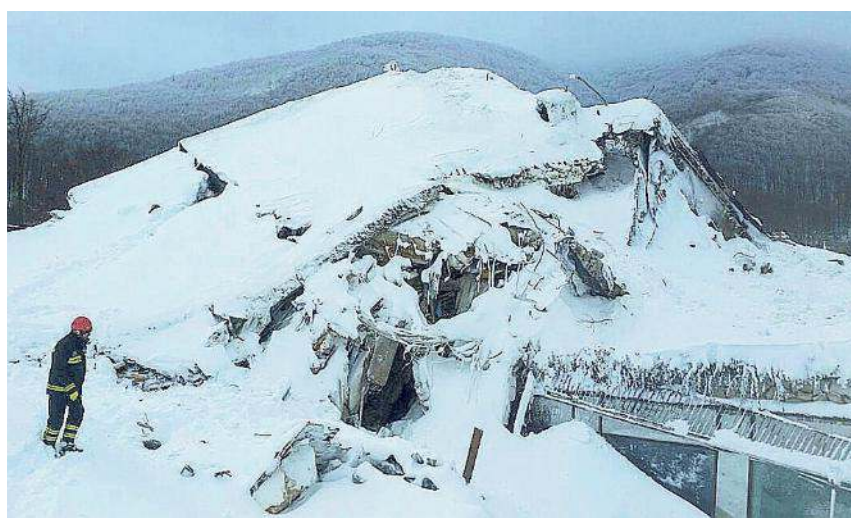
A destra l'hotel Rigopiano distrutto dalla valanga. A sinistra un'altra immagine del resort di Farindola. La struttura era stata rinnovata nel 2008