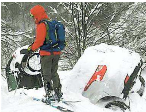
Le operazioni di soccorso a Rigopiano