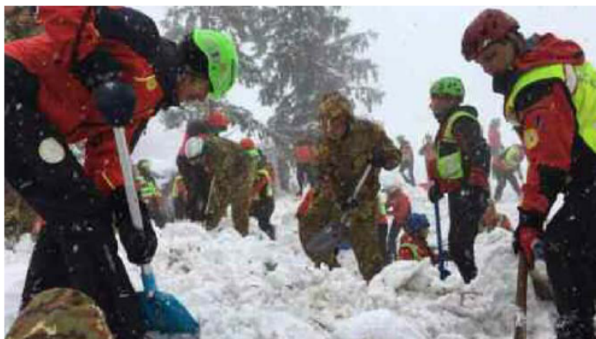
Soccorritori al lavoro a Rigopiano