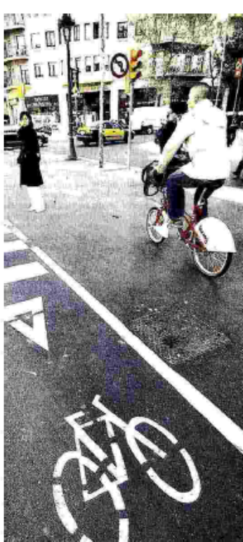
Ciclisti in sicurezza. In sei capoluoghi non esistono piste ciclabili