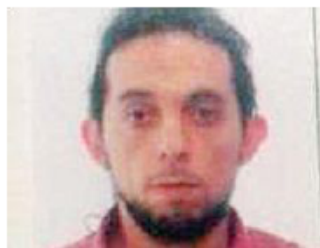
Un'altra immagine della vittima

Il dolore dei colleghi: era un combattente sempre in prima linea per la difesa dei lavoratori