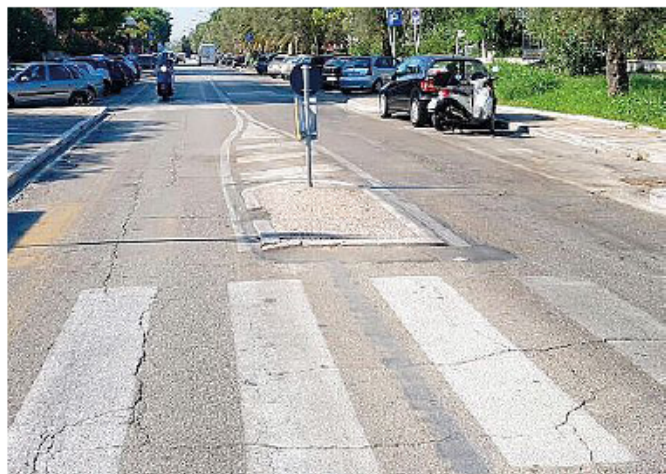
La zona dove si è verificato l'incidente, sulla riviera nord

Sono tanti gli interrogativi a cui rispondere nelle prossime ore, ad esempio sulla velocità