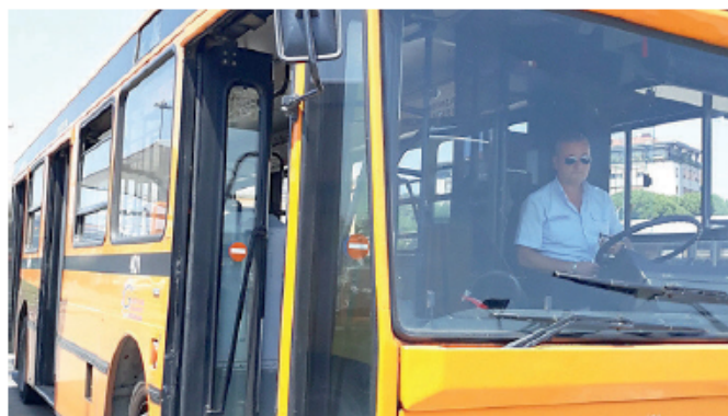
Una delle vetture arancioni dei tempi della Gestione Governativa

No, i problemi arrivano soprattutto con il caldo. In estate, spesso non funziona l'aria condizionata. Ma ci sono anche autobus che il sistema