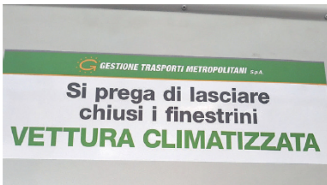
Il cartello affisso a bordo dei mezzi dove l'aria non funziona quasi mai