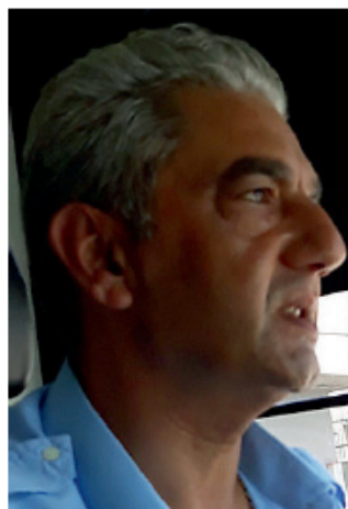
L'autista della linea 5