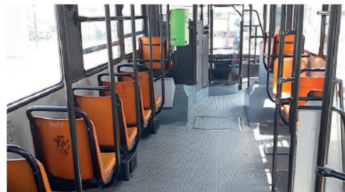
L'interno di uno dei vecchi mezzi in circolazione, ancora a gasolio