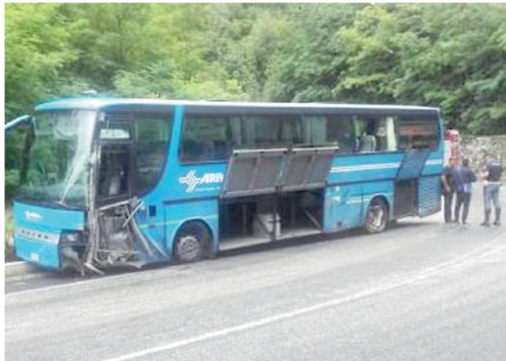
Il pullman della Tua coinvolto nell'incidente sulla Statale 17

to deciso di fare ulteriori accertamenti e per questo sono stati trasportati al pronto soccorso di Sulmona. I feriti, tutti spaventati e molto provati, hanno riportato contusioni ed emato-