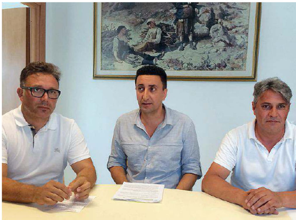
La conferenza stampa dei sindacalisti

Un piano industriale che penalizza le zone interne dell'Abruzzo e in particolare la provincia dell'Aquila, fino a far rischiare la "desertificazione dei servizi". Bocciato senza appello, da Filt-Cgil e Ugl, il progetto di Tua, la neonata azienda unica del trasporto pubblico regionale: i due sindacati hanno proclamato un'intera giornata di sciopero per il prossimo 7 agosto, che sarà preceduta martedì da 4 ore di protesta unitarie nel distretto di Avezzano. Le scelte strategiche volte a eliminare la sovrapposizione tra le corse su gomma e quelle su ferro si sono rivelate, nelle intenzioni di Tua, una "mazzata" per il trasporto pubblico dell'Abruzzo interno, dove vengono eliminati oltre 700mila chilometri, ma senza la copertura adeguata del servizio ferroviario. Sotto accusa anche la Regione, che taglia 10 milioni dal fondo trasporto, provocando 144 esuberanti tra gli autisti dei mezzi pubblici. E che disattende una legge specifica, che prevedeva l'estensione del biglietto unico, al costo di 1,10 a tutto il territorio regionale: da dieci anni ne beneficia solo l'area metropolitana Chieti-Pescara e in via sperimentale sarà attivato nella zona di Lanciano. Ad annunciare le manifestazioni di protesta sono stati il segretario della Filt-Cgil Domenico Fontana e il segretario Ugl Guido Pignagnacchi, che criticano anche le subconcessioni ai privati di oltre 1 milione e 644mila chilo-