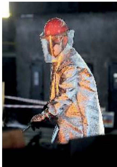
A sinistra, un lavoratore impegnato in una fonderia, uno dei lavori definiti usuranti e beneficiari dell'Ape sociale