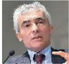
Tito Boeri, presidente Inps

«Per l'Ape social, siamo molto vicini al risultato. Siamo pronti, nel momento in cui fosse pubblicato il DPCM, a partire nel giro di mezza giornata». Lo ha affermato il presidente dell'Inps, Tito Boeri, rispondendo alla domanda se ritiene possibile rispettare la scadenza del primo maggio per l'avvio dell'anticipo pensionistico, a margine della presentazione del festival dell'Economia di Trento. «Abbiamo già praticamente la circolare pronta, a meno di cambiamenti indotti dal Consiglio di Stato della Corte dei conti», ha aggiunto. «Per l'ape