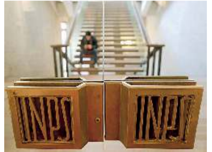
La sede della direzione generale dell'Inps a Roma

Ma vediamo come deve comportarsi l'assicurato. In primo luogo l'interessato dovrà farsi certificare dall'Inps il possesso dei requisiti per avere diritto all'Ape. Chi vorrà usufruire del pensionamento anticipato volontario tramite un mutuo acceso presso una banca dovrà avere, infatti, un minimo di 63 anni di età e 20 anni di contributi, trovarsi a non più di 3 anni e 7 mesi dal pensionamento di vecchiaia nel regime obbligatorio e soddisfare l'ulteriore condizione di ottenere un importo della futura pensione mensile, al netto della rata di ammortamento per il rimborso del prestito richiesto, non inferiore a 1,4 volte il trattamento minimo dell'assicurazione generale obbligatoria (cioè 702,65 euro al mese). Inoltre la durata minima dell'Ape è di sei mesi. Pertanto sono esclusi coloro che raggiungeranno il diritto alla pensione entro il mese di ottobre di quest'anno, cioè i nati entro il mese di marzo del 1951. La domanda di certificazione potrà essere effettuata all'Inps esclusivamente tramite via telematica (con il codice pin personale) oppure rivolgendosi presso un intermediario abilitato (ad esempio i pa-