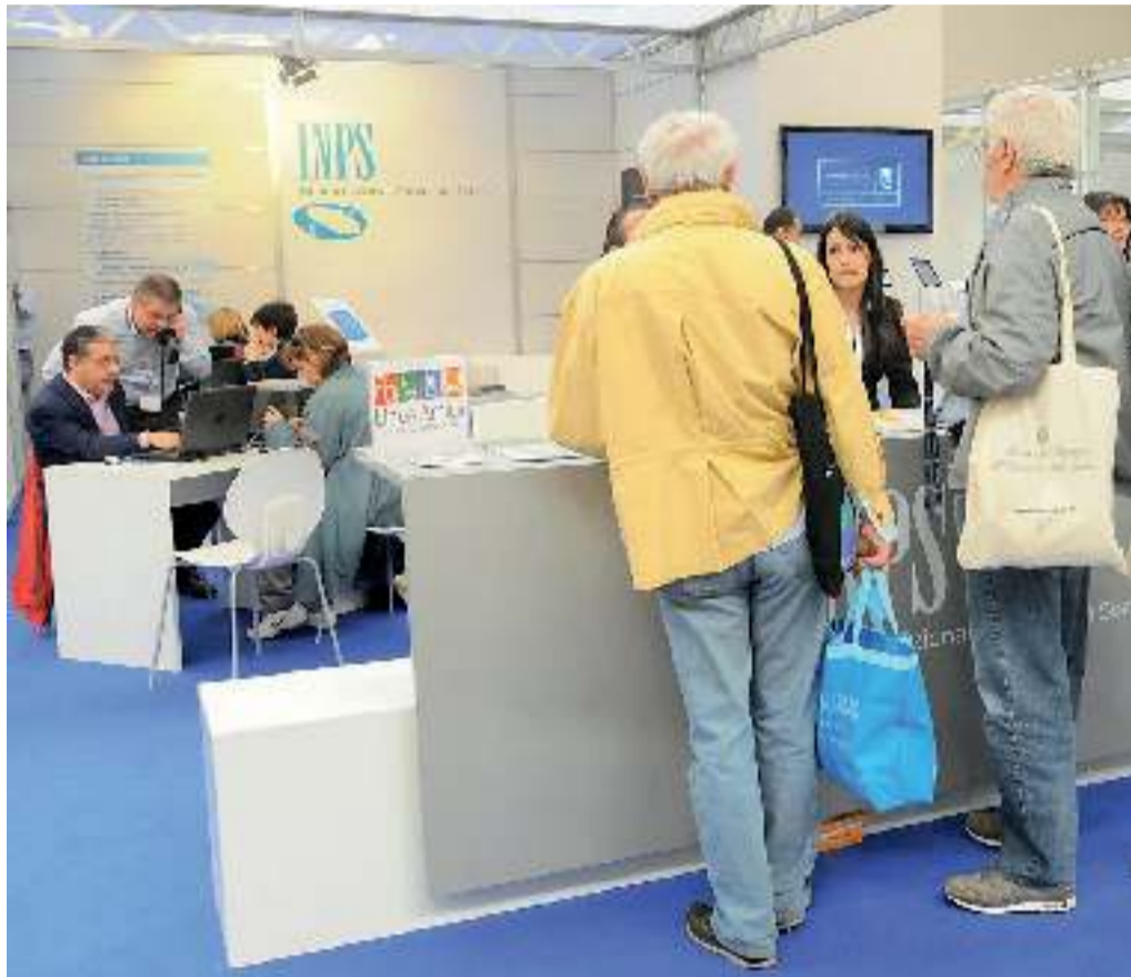
Un ufficio dell'Inps, l'istituto nazionale di previdenza sociale

«Per Ape e Ape sociale l'impatto sulle sedi Inps d'Abruzzo non dovrebbe essere particolarmente forte in termini numerici. E comunque sarà gesti-