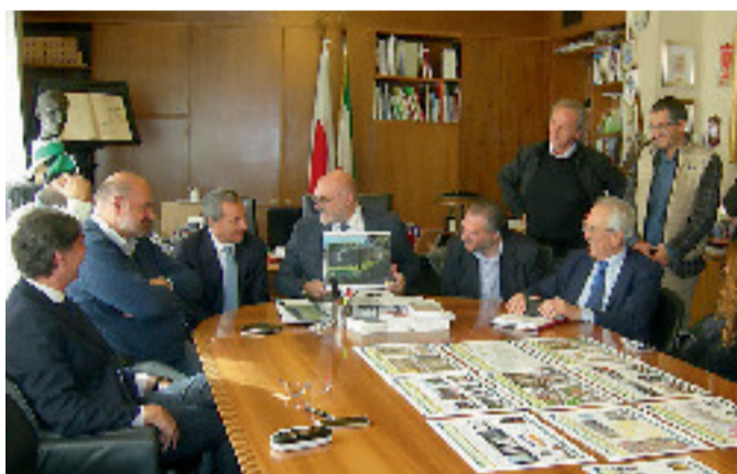
La presentazione dei progetti

verso l'installazione di 6 ciclostazioni di ricarica con autoalimentazione a pannelli fotovoltaici composte da 60 ciclopoteggi, 60 bici elettriche, 60 cavi antifurto, 60 kit tessera elettronica e segnaletica. Dove? In piazza Garibaldi, largo Cavallerizza, Vil-